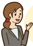
WOW WOW WORLD 当社担当 ディレクター

「初めてメルマガを配信することになり、不安ばかりでしたが、無事にメルマガが配信できたのはご担当者様が親身になってサポートしてくださったからだと思います。今後とも、よろしくお願いします」