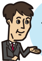
住宅メーカー ご担当者様

「初めてメルマガを配信することになり、不安ばかりでしたが、無事にメルマガが配信できたのはご担当者様が親身になってサポートしてくださったからだと思います。今後とも、よろしくお願いします」