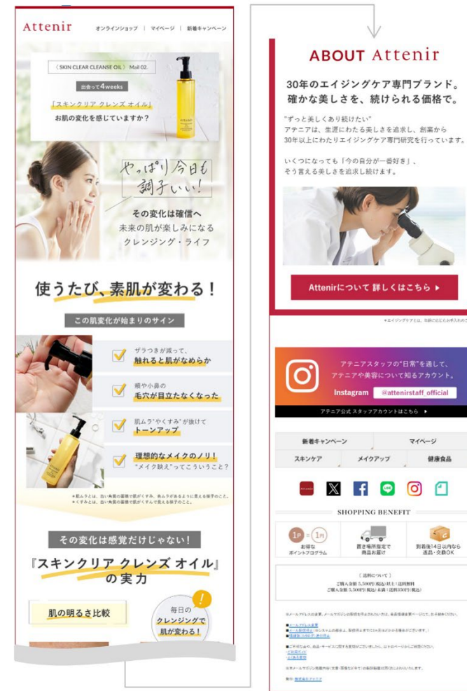
「スキנקリア クレンジング オイル」フォローメール

「ドレススノー」「ドレスリフト」の2ブランドについて、購入者向けフォローメールの各メール、シナリオ全体の効果検証も実施しました。